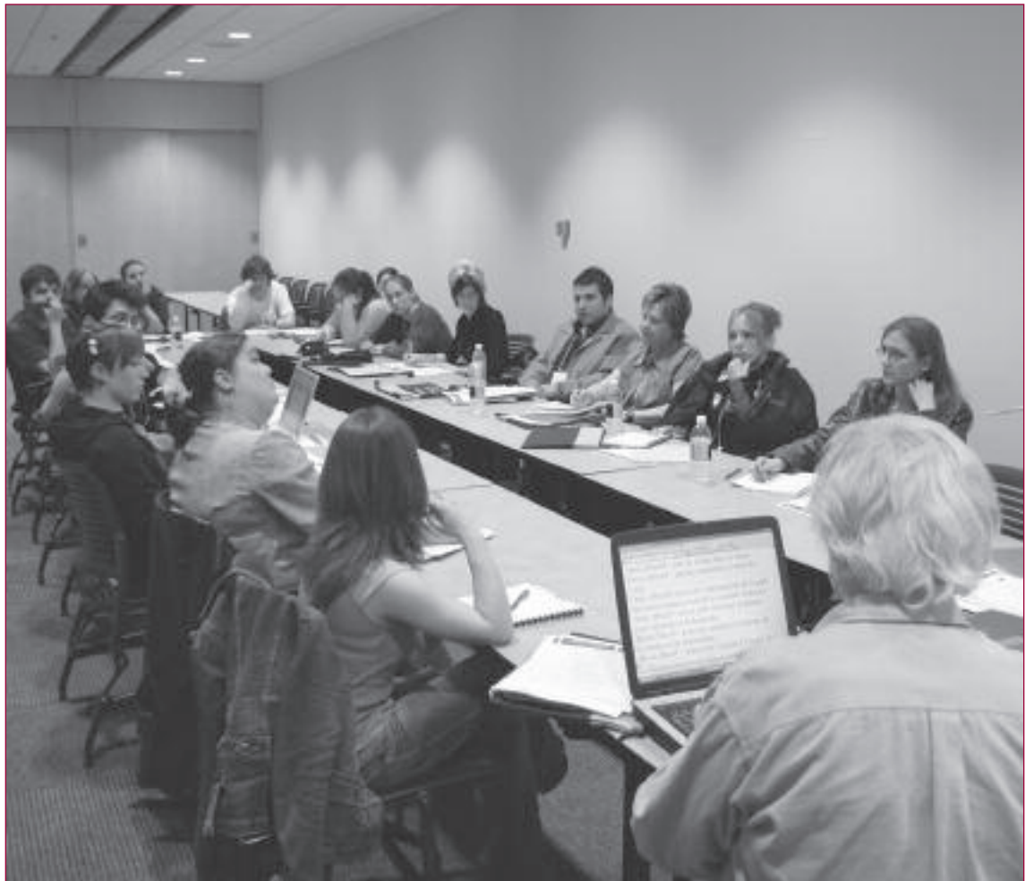
C'est dans le cadre des colloques des adultes en formation qu'est né le MQAF.

La Semaine québécoise des adultes en formation ayant été déplacée au printemps, le