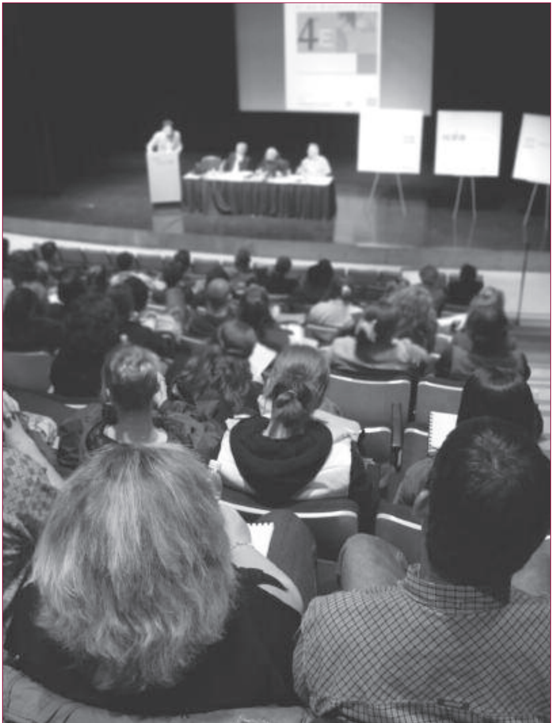
Chacun des ateliers formule des propositions qui sont soumises à l'assemblée générale. Le cas échéant, ces propositions sont intégrées dans le programme politique du MQAF.

2. À l'université, on considère comme adultes une personne de 25 ans et plus inscrite dans un programme de 1 er cycle.